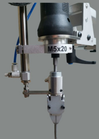
Schrauber mit Überhub und Magnet